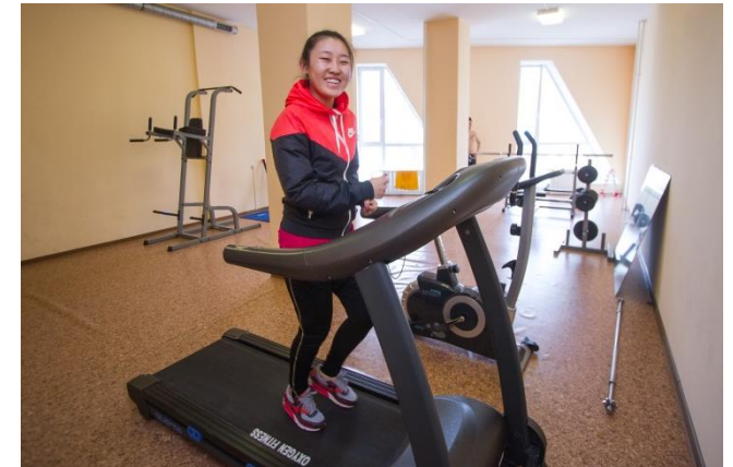
Новый жилой комплекс «Парус»