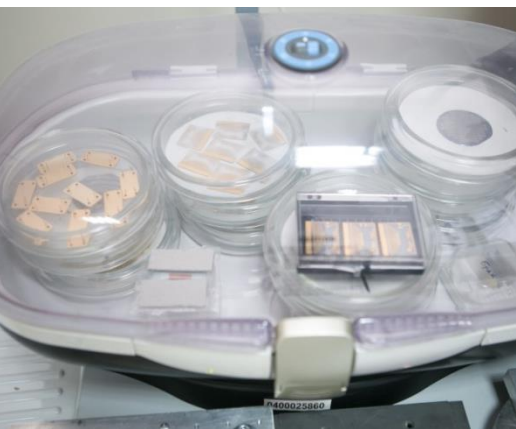
Технологии GaAs полупроводниковых структур, разработанные в ТГУ, используются в DESY, CERN и ряде spin-off компаний мира, например Dectris