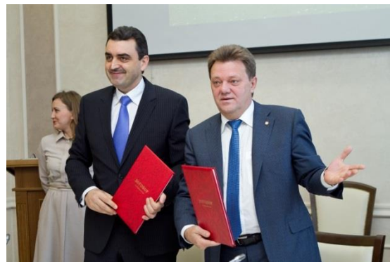
Сотрудничество с администрацией Томска