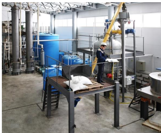
Оборот Инжинирингового центра ТГУ в первом полугодии 2016 года составил 171,5 млн рублей