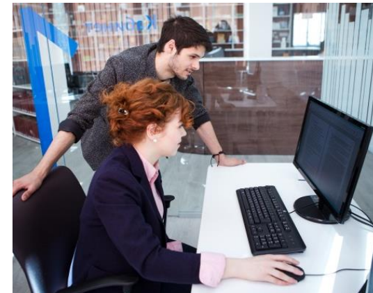
Исследовательский зал НБ ТГУ