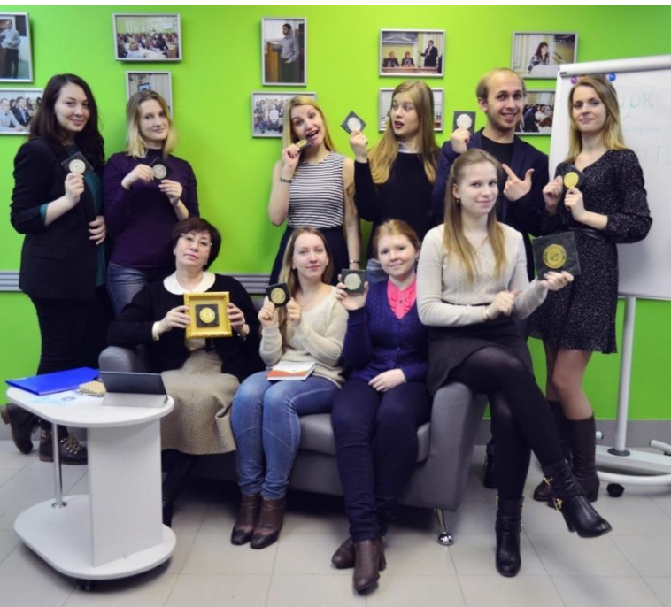
Парк социогуманитарных технологий