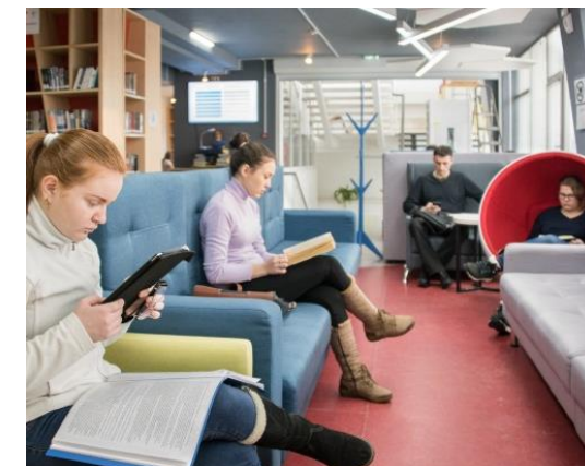
Круглосуточный читальный зал НБ ТГУ